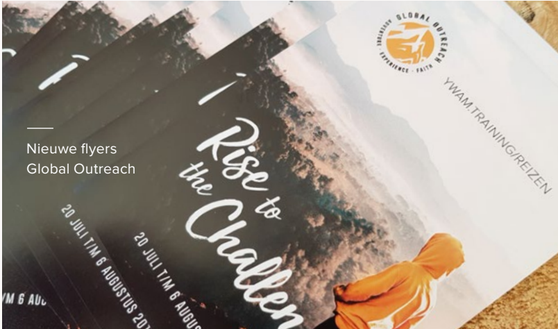
Nieuwe flyers Global Outreach

Sponsors wil ik graag bedanken voor hun maandelijks ondersteuning.