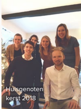
Huisgenoten kerst 2018